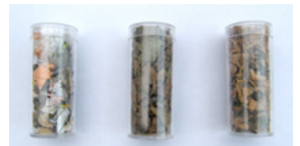
3 Botes de registro. Plástico transparente de 5,5cm altura y 2,3 ø.